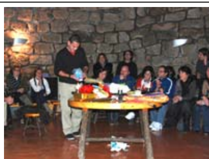
XII Curso de Pedagogía Artística MUS-E®