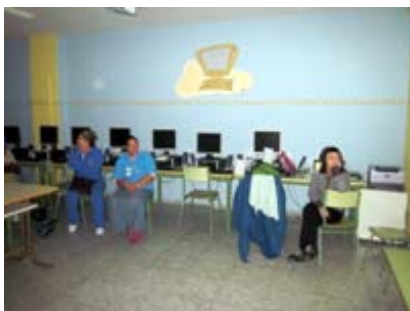
Enseñando el MUS-E® a las familias