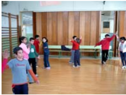
Taller MUS-E® Danza CEOP Barriomar 74