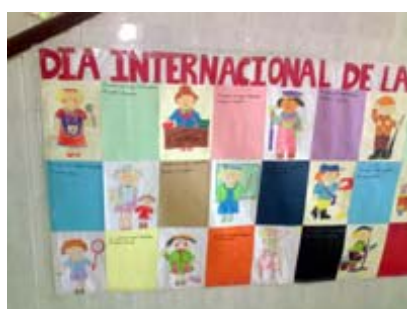
Taller MUS-E® Sonsóles Oteiza.