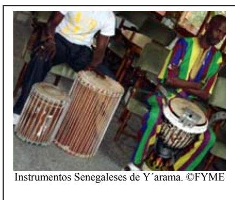
Instrumentos Senegaleses de Y'arama.

¿Conoces los instrumentos de percusión africanos? ¿Sabes la diferencia entre Djembé , Sabar , Tama o el Dumbum ? Aquí podríamos darte cuatro notas, pero mucho más que lo que aquí podríamos contarte saben ya los chicos y chicas de los Institutos de secundaria, San Cristóbal, Villaverde y Ciudad de los Ángeles de Madrid. Pues, en Marzo, los carnavales días 4, 5 y 9 no solo tuvieron la clase teórica, sino que tuvieron la suerte de sentir entre sus manos la textura de los instrumentos y aprender a tocarlos.