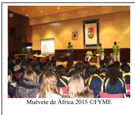
Muévete de África 2015

Los protagonistas fueron todos, alumnos, padres, profesores y la gente del barrio. Bullicio, animación y cultura popular se trasladaron al CEIP Dulce Chacón de Madrid para celebrar las fiestas del carnaval el día 4 de Marzo. Nada es comparable a vivir el pasacalles, una música que nace y se vive en la calle, sonidos que contagian el ambiente festivo, de saber que uno puede ser otro con solo ponerse máscaras y disfraces. Acompañar a comparsas es lo que hicieron nuestros chicos y chicas en lo que se sabe es un día grande.