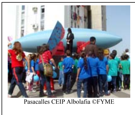
Pasacalles CEIP Albolafia