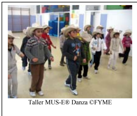
Taller MUS-E® Danza