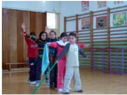
Taller MUS-E® Danza CEOP Barriomar 74