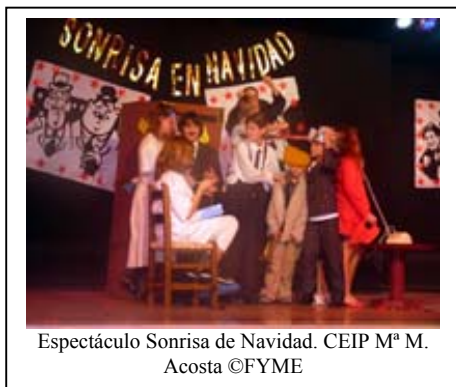
Espectáculo Sonrisa de Navidad. CEIP M a M. Acosta