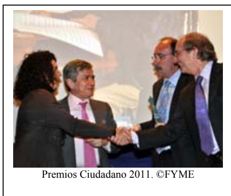
Premios Ciudadano 2011.