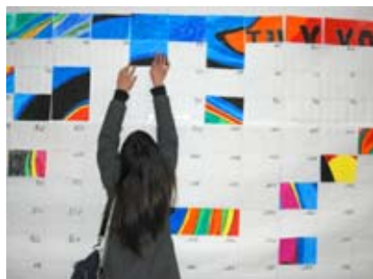
Semana Solidaria Universidad Carlos III de Madrid.

Descubrir un continente tan cercano a nosotros es un empeño de la FYME, el programa “Enséñame África”, es ya un referente en la Comunidad de Madrid, de intercambio cultural y por tanto de conocimiento mutuo con este continente vecino. Mostrar el trabajo de su campaña “Retrovirales” fue el objetivo de la Asociación Amigos de Nyumbani y todos juntos con papel y pinturas hicieron de pedazos sueltos un “Mural colectivo”. Tú solo no abarcas mucho, pero junto a los demás eres capaz de comerte el mundo.