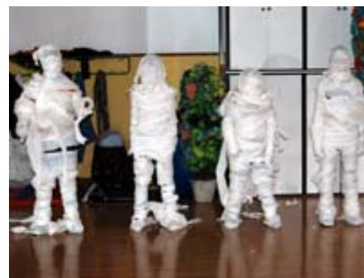
Taller MUS-E® Audiovisuales CEIP Miguel de Unamuno