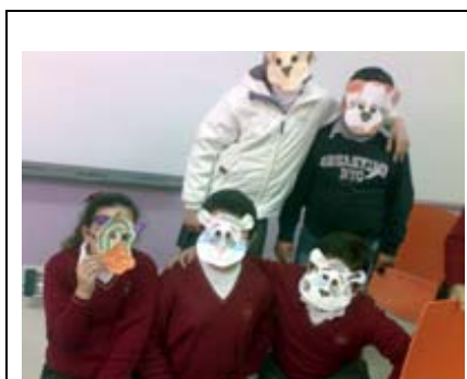
Taller MUS-E® Sonsóles Oteiza.