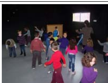
Taller MUS-E Danza

Africana Noticias; La FYME, recibe de manera periódica este boletín de noticias realizado por la Fundación Sur, en donde encontraremos mucha y buena información sobre el continente africano difíciles de encontrar en la prensa que nos rodea habitualmente, si alguno estáis interesados en saber más y desde otro punto de vista sobre el continente vecino, poneros en contacto con nosotros y os facilitaremos multitud de artículos y noticias de todo aquello que no nos cuentan.