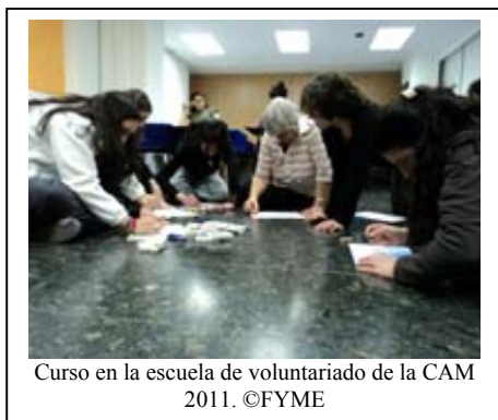
Curso en la escuela de voluntariado de la CAM 2011.

“Técnicas, herramientas y recursos lúdicos para la animación sociocultural desde la acción voluntaria” , este fue el título del curso que realizó la FYME sobre Voluntariado durante la segunda quincena del pasado mes de Enero. Sin organización no existe eficacia que valga y la participación ciudadana se dispersa y diluye. Para conseguir que esto no ocurra, sino más lo contrario, es necesario implementar una técnica de actuación focalizada en centrar la formación y canalizar la información. Conseguir estos objetivos es lo inculcó el equipo de profesionales de la FYME que dirigió todo el curso.