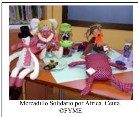
Mercadillo Solidario por África. Ceuta.

africanos, conocer la realidad de este vasto continente, más allá de los estereotipos que circulan, es lo que pretende la campaña Muévete por África, dentro del programa que desarrolla la FYME, Enséñame África. Color del mural viajero y calor de los talleres artísticos, desembarcaron, en el IES Loranca de Fuenlabrada, entre los días 4, 7, 8 y 16 de marzo.