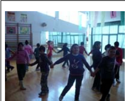
Taller MUS-E® Danza CEOP Barriomar 74