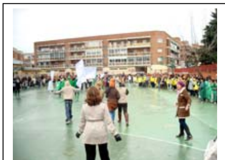
CEIP San Pio. 12 de Marzo de 2011

Otra nueva forma de crear escuela, “ Metodología MUS-E® contra el Absentismo y por la Participación ”. Contra el absentismo, este es el compromiso que han asumido los centros escolares: IES; Luís Braille, CEIP San Pío X, CEIP Joaquín Dicenta y el CEIP Vicálvaro de Madrid, para acabar con este grave problema que afecta al desarrollo personal y profesional de los alumnos. Arte para acercar la Escuela, para hacer que éstos sientan confianza en sí mismos, Arte en acción, contenidos llenos de Arte, que se desarrollan en talleres participativos de todos y con todos, alumnos, padres y madres.