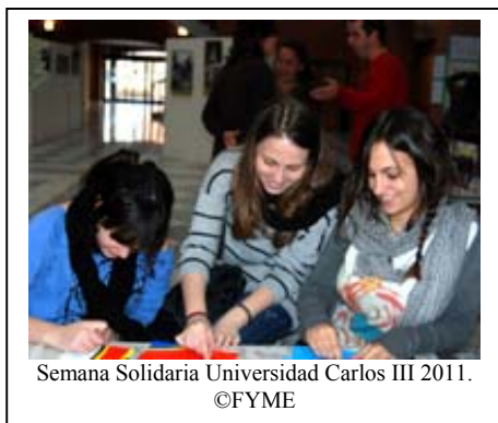
Semana Solidaria Universidad Carlos III 2011.

Toda una semana para oír a los que no tienen voz. El altavoz lo puso la Universidad Carlos III de Getafe, Madrid, entre los días 21-25 de Febrero. Un gran número de Organizaciones se sumaron a esta iniciativa en la que no faltó la FYME.