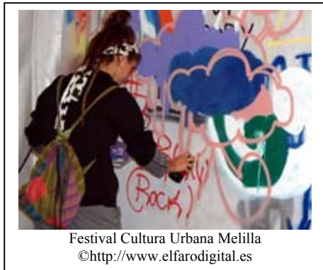
Festival Cultura Urbana Melilla