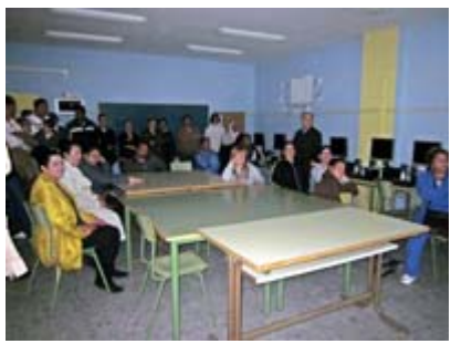
Enseñando el MUS-E® a las familias