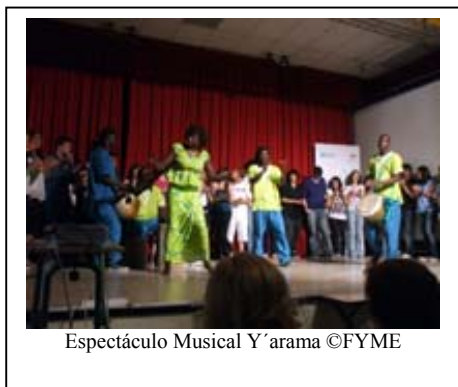
Espectáculo Musical Y'arama

Es verdad, incluso aquí en España, los sonidos de los Djembés , llegan mucho más lejos de lo que en principio podría parecer. Influenciados por la experiencia de otros centros, el Instituto Celestino Mutis de Madrid, quiso que en sus aulas resonaran los sonidos de África. El acercamiento a esta música llegó el pasado día 2 de Marzo de la mano del grupo musical senegalés Y'ARAMA, y fue tal la emoción que allí se sintió, que este Instituto se sumará el próximo curso al programa “Enséñame África” .