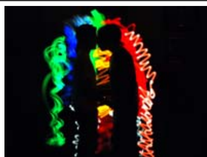
Taller Realizado en la Visita del C. Menesianos a la sede de la FYME.

Una energía y entusiasmo que la FYME canalizó los pasados días 1 y 2 de Marzo, por medio de cajas. Pero, no eran unas simples cajas, no, sino que se trataba de “Cajas Solidarias”, que construyendo el mapa de la Comunidad de Madrid, nos invitaban a abrir y destapar. Al principio eran solo cajas sueltas, vacías de contenido y color, que, entre todos, al pintar, armar y llenar, consiguieron mostrar a los demás lo que había dentro, escenas de esta palabra, solidaridad. El material para hacerlo posible nos lo facilitó la consultora KPMG, por ello, Gracias.