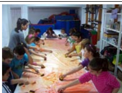
CEIP Hernández Ardieta