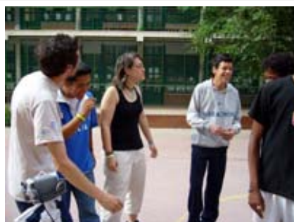
Grabación de Cortos MUS-E® en Villaverde

La Comunidad de Madrid ha organizado “El primer concurso de Micro Films 2010-2011”