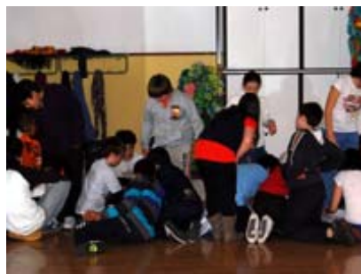
Taller MUS-E® Audiovisuales CEIP Miguel de Unamuno