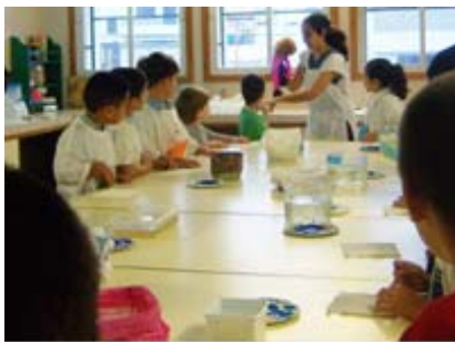
Taller MUS-E® Artes Plásticas Canarias