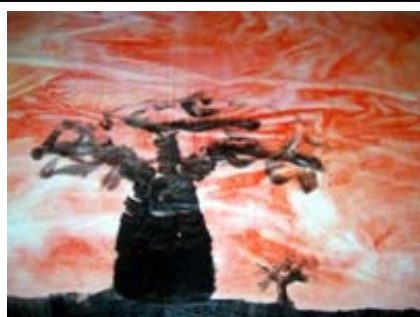
CEIP Hernández Ardieta