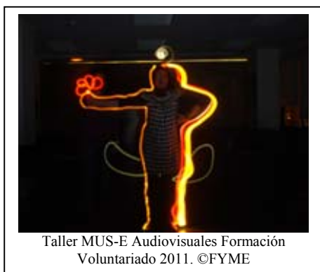
Taller MUS-E Audiovisuales Formación Voluntariado 2011.

El voluntariado, en la Comunidad de Madrid, está conectado a través de una Red de Puntos de Información del Voluntariado (PIV). Fue en uno de estos centros, concretamente en el de la localidad madrileña de Getafe, donde se impartió el curso “Técnicas creativas para la resolución de conflictos” . Tres días del mes de Febrero, 22, 23 y 24 con el objetivo de fomentar las relaciones interpersonales, la comunicación y el desarrollo personal a través de la actividad, así como mejorar vínculos y vivencias que surgieron entre los participantes; se trabajó la comunicación personal con creatividad, el conflicto y las estrategias aplicadas.