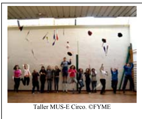
Taller MUS-E Circo.