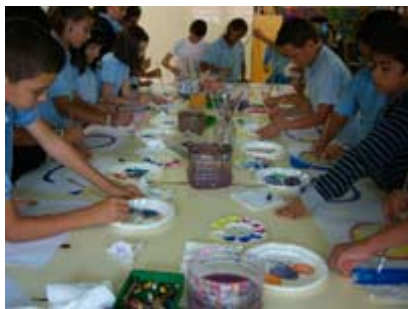
Taller MUS-E® Artes Plásticas Canarias