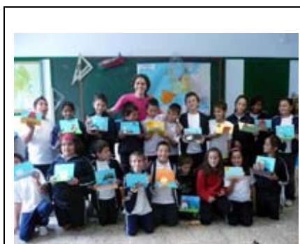
Taller MUS-E® Artes Plásticas en el CEIP Dulce Chacon.