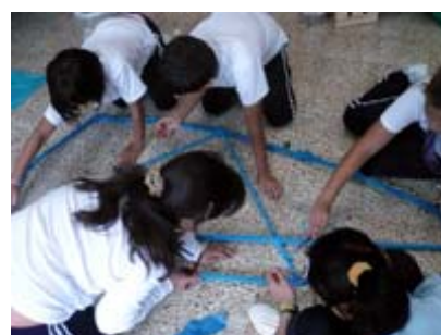
Taller MUS-E® Artes Plásticas en el CEIP Dulce Chacon