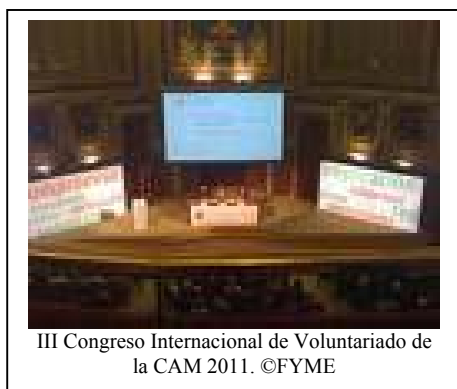
III Congreso Internacional de Voluntariado de la CAM 2011.

Que la sociedad del siglo XXI tenga unos ciudadanos activos, comprometidos y participativos. Estos fueron los objetivos que analizó III Congreso Internacional de Voluntariado de la Comunidad de Madrid . Dos días de Enero 26 y 27 un nutrido grupo de expertos e Instituciones, entre ellas la FYME, buenas conocedoras de cómo se aborda el trabajo en el campo del voluntariado, analizaron la situación actual y apuntaron el camino a seguir en un futuro próximo. Un ejemplo de las ponencias fue la que aportó Eduard Punset, quién señalara que en el futuro las sociedades tienden a ser