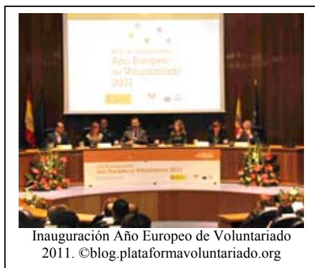
Inauguración Año Europeo de Voluntariado 2011.

Sin voluntarios el mundo sería mucho peor, para mejorarlo tenemos todo un año, este en el que estamos, el 2011. Reconocer la labor social que hacen miles de voluntarios y organizaciones que desarrollan acciones de voluntariado, entre ellas nuestra Fundación y su “enjambre” de voluntarios, fue lo que se proclamó el pasado 1 de Febrero en el Salón de actos Ernest Lluch del Ministerio de Sanidad, Política Social e Igualdad, en presencia de SS. AA. RR. los Príncipes de Asturias. Este es el gran reto que se ha marcado la Unión Europea para todo un año, difundir en nuestra sociedad