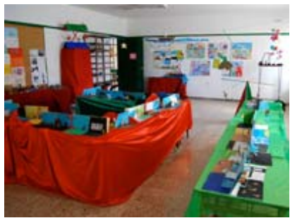
Taller MUS-E® Artes Plásticas Canarias