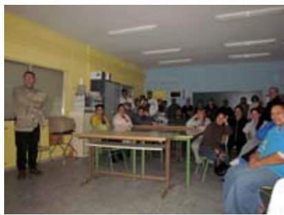
Enseñando el MUS-E® a las familias