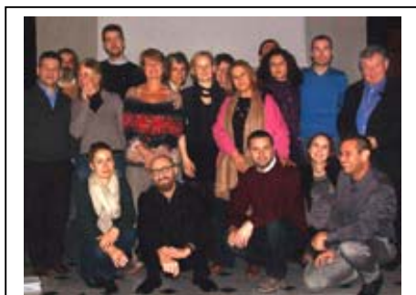
Comité de Coordinadores del Programa MUS-E®. 2011