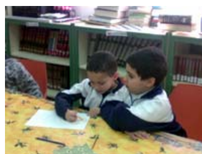
Taller MUS-E® Sonsóles Oteiza.