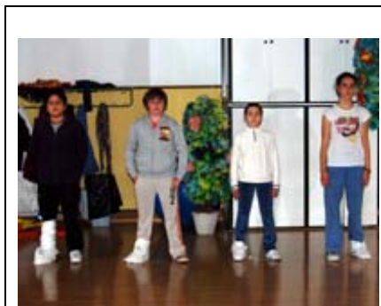
Taller MUS-E® Audiovisuales CEIP Miguel de Unamuno