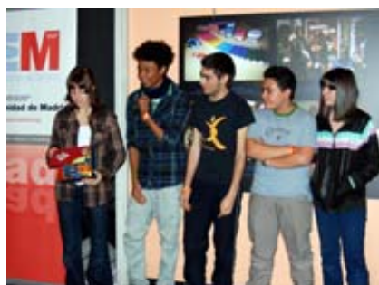
Tour Año Europeo del Voluntariado.

El 28 de Febrero le tocó el turno a Madrid, el Tour del año Europeo del Voluntariado, que recorrerá los 27 Estados de la Unión Europea, arribó este día a la capital. Un espacio de encuentro y reflexión conjunta entre voluntarios, organizaciones que trabajan en el campo del voluntariado y la ciudadanía con el objetivo de obtener el reconocimiento social de lo que significa la actividad voluntaria. Unos y otros quisieron exhibir sus logros, reflexionar sobre sus preocupaciones, difundir en la sociedad valores como la solidaridad, participación y cambio social.