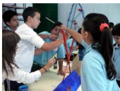
Taller MUS-E® Artes Plásticas en el CEIP Dulce Chacon