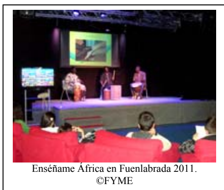
Enseñame África en Fuenlabrada 2011.

De Enero a Junio Fuenlabrada y África están más cerca que lo que podría parecer en un mapa. El proyecto de este año, “ MUS-EANDO Nos movemos por el derecho a la educación en Senegal ”, quiere presentar una imagen de un continente lleno de riquezas, la de su gente y su cultura. “ Enseñame África ” pretende ampliar nuestra mirada, despertar el sentido solidario y de cooperación, saber que nosotros también podemos aportar nuestro granito de arena. La campaña utiliza el Arte como herramienta de trabajo, Arte de todo aquello que está vivo, que transforma, que nos mueve, es decir, Lo que te mueve te conmueve y pasas a la acción . Talleres de música, danza, percusión, puzzles, murales y cuentos viajeros que llegarán a Senegal, irán tan lejos y se sentirán tan hondo que nos enseñará a mirar con los ojos del corazón.