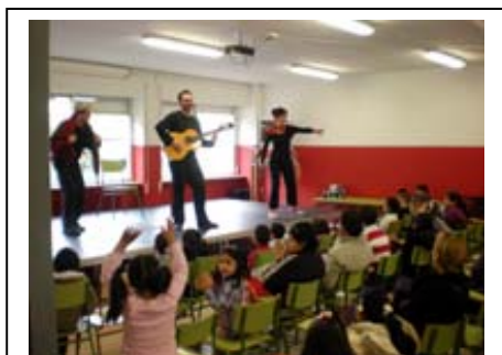
CEIP San Pio. 12 de Marzo de 2011

Otra nueva forma de crear escuela, “ Metodología MUS-E® contra el Absentismo y por la Participación ”. Contra el absentismo, este es el compromiso que han asumido los centros escolares: IES; Luís Braille, CEIP San Pío X, CEIP Joaquín Dicenta y el CEIP Vicálvaro de Madrid, para acabar con este grave problema que afecta al desarrollo personal y profesional de los alumnos. Arte para acercar la Escuela, para hacer que éstos sientan confianza en sí mismos, Arte en acción, contenidos llenos de Arte, que se desarrollan en talleres participativos de todos y con todos, alumnos, padres y madres.