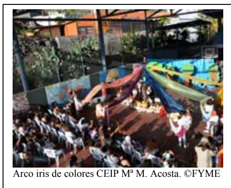
Arco iris de colores CEIP M a M. Acosta.