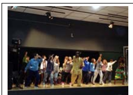
Espectáculo de Bienvenida al IES Huerta del Rosario