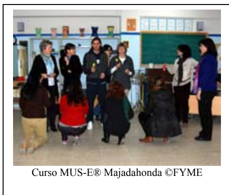
Curso MUS-E® Majadahonda

El Ayuntamiento de Majadahonda, Madrid, en colaboración con la Consejería de Educación de esta Comunidad, confiaron en la experiencia de la FYME para poner en marcha el curso: “Las Artes como herramienta de trabajo”. Basado en la metodología MUS-E®, más de 20 profesores de los CEIP A. Machado y San Pío X, conocieron de primera mano, entre los meses de febrero y abril, la interrelación y el trabajo transversal de las artes, música, teatro, danza y A. plásticas como método de aprendizaje de todas las demás materias educativas. La experiencia fue tan positiva que esperamos repetir.