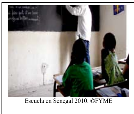
Escuela en Senegal 2010.

No resignarse, mirar a nuestro alrededor, ver lo que podemos hacer y actuar para que el futuro sea diferente. Para ello, este año como regalo os pedimos colaborar con el programa “ Capacitarse Senegal 2011 ”. Desde su independencia, Senegal, hace frente a muchos déficits, uno de los más sangrantes es el del analfabetismo de su población, de sus 12 millones de habitantes el 72% pertenecen a este grupo y en el caso de las mujeres el porcentaje llega hasta el desgarrador 90%. Desarrollar Senegal pasa por formar profesionales en sectores capaces de aportar plusvalías y generar empleo.